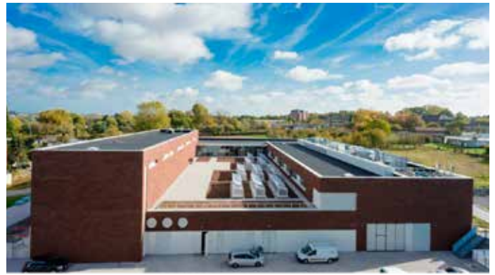
Complexe de recherche TERRA