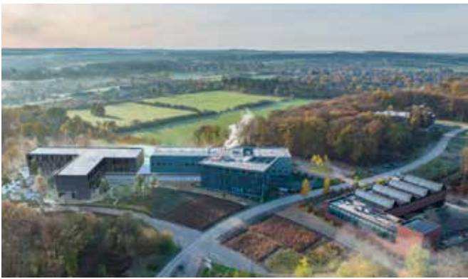
Centres Novalis – Préclinique & BoostUp