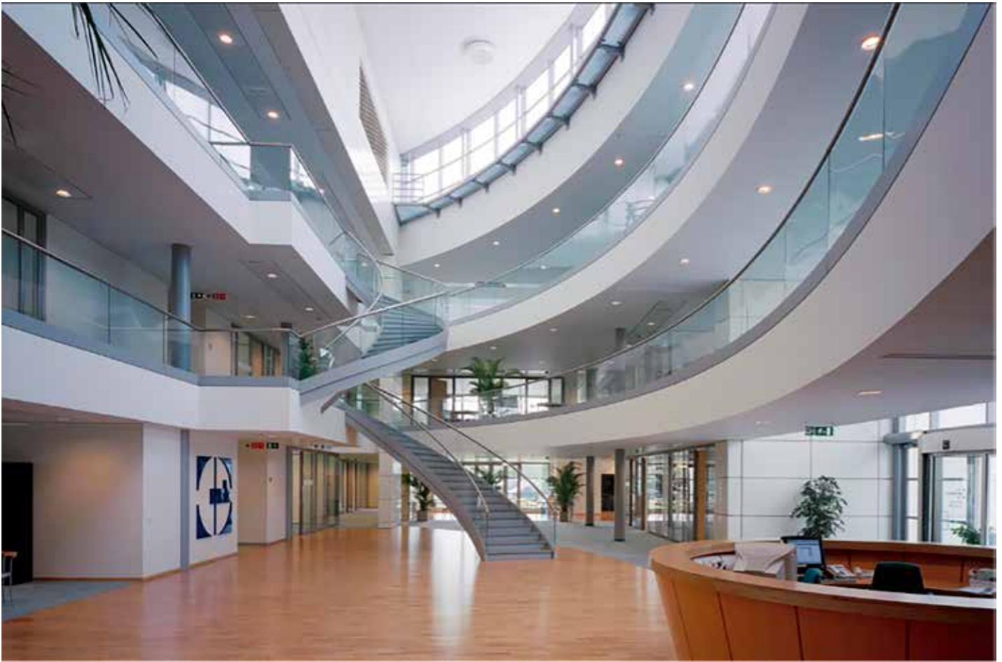
Laboratoires CYTEC (ex-UCB, Groupe Solvay)