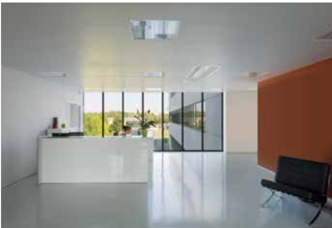
Plateforme Wallonne de Thérapie Cellulaire (PWTC)