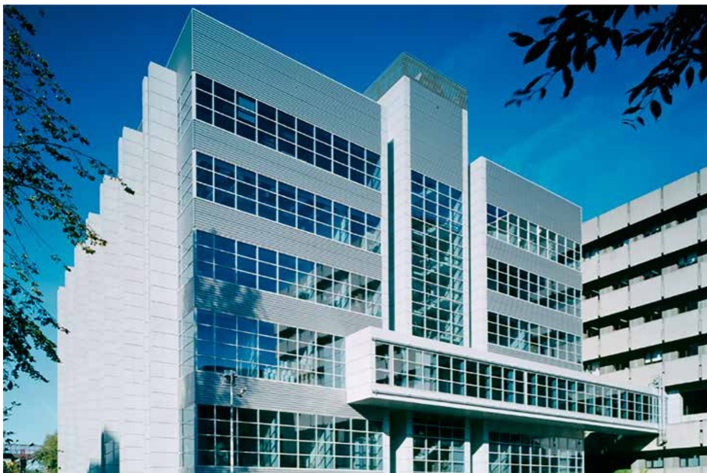
Tour Franklin (Cliniques Universitaires Saint-Luc)

Cette conception flexible a déjà permis à plusieurs reprises en cours de construction et après la mise en service d'adapter la programmation des locaux sans modifier la structure en offrant toujours des possibilités d'évolution significatives.