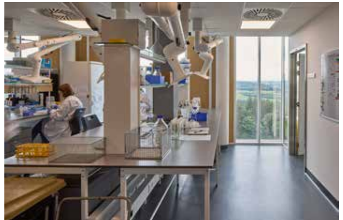
CHU de Liège – Unilab